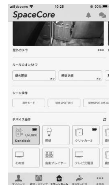
▲専用アプリ『SpaceCore』で操作が可能

『SpaceCore（スペースコア）』では、専用アプリでドアの施錠や家電の操作など複数の機器を制御できるようなっている。アプリ上での操作が、インターネットに接続したハブ機器『Smart Station（スマートステーション）』を介して居室内に設置した鍵や各種センサーなどの機器に信号が送られる仕組みだ。アプリ画面に表示される「テレビ」「リビング照明」などのボタンをタップするだけで各種機器のオン・オフの操作ができるほか、「おはようシーン」「お出かけシーン」など、時間帯や状況に応じて役立つ機能だ。顔認証で登録した入居者自身の検温結果は専用アプリに通知され、確認することもできる。既存物件へのシステム導入費用は約60万円。最短期間程度で設置可能だ。今後は4月竣工予定の賃貸マンション『リバーレ芝公園』や、リバーレシリーズの既存物件にも順次導入を計画している。ライナフの滝沢潔社長は、「賃貸住宅において非対面、非接