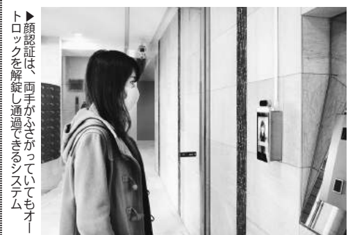
▶顔認証は、両手がふさがっていてもスマートロックを解錠し通過できるシステム

スマートロックの開発・提供などを行っているIoT企業のライナフ（東京都文京区）が賃貸マンション『リバーレ浅草ウエスト』に採用された。